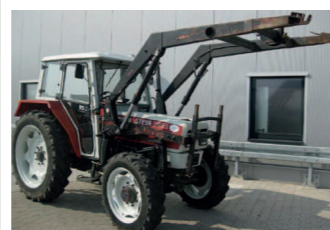
2254393 Steyr 8065 RS2 BJ 1990, 11602 h, Einfahrfrotlader Hauer Gr.3