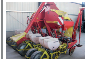
2157660 Kverneland MulticorN BJ 2005, e-Drive, Reihendüngerstreuer, Maisleiger: 6 reihig Normalsaat, Düngerschare in Mulchsaatführung