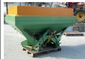
2093829 Amazone ZAU 1200 gebr. Düngerstreuer, 1200 Ltr., Arbeitsbreite bis 24 m