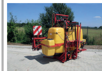
2222537 Gs12Hy15 BJ 2000, Fassvolumen 12000 Liter, Arbeitsbreite: 15 mtr hydr. Klappbar, 5 Teilbreiten