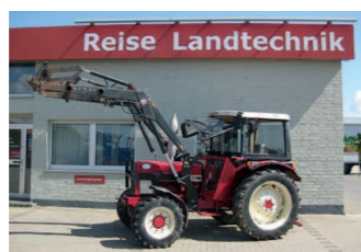
2201473 Case IH 633 A BJ 1985, 5631 h, Frontlader, Baujahr: 1985, 1 x DW, 1 x EW, 540/1000 Zapfwelle, Fritzmeierdach, feste Seitenteile