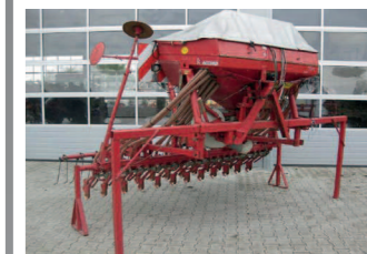
2283984 Kverneland DA 24 Tankinhalt mit Aufsatz 750 ltr., Normalschar, 5-Saatstriegel, Mikrodosierung, mech. Hektarähler, 6 Magnetklappen