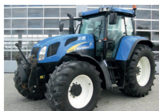
2273436 New Holland TVT 145 BJ 2006, 5632 h, Allrad, Fronthubwerk, Gefederte Vorderachse, Kabine, Klimaanlage