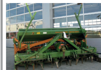
2265821 Amazone RPD 301 Fahrgassenschaltung, Nachlaufwalze, Striegel, gebr. Säkombination, Drille und Kreislegege, KG 301, mit Reifenpacker, mit 24 Schleppscharen