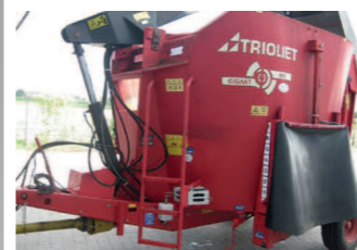
2270432 Trioliet Gigant 900 BJ 2010, Selbstladender Futtermischwagen, Eine Vertikalschnecke, Beidseitige hydr. Dosierschieber, hydr. Bremsanlage mit Feststellbremse