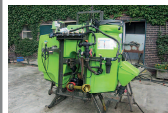
2229576 Tecnomas 1000 L 15mtr Fassvolumen: 1000 Liter, - Arbeitsbreite 15 mtr, handklappbar, hydr. Höhenverstellung