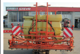
2177338 Douven 800L 15mtr Fassvolumen: 800 Liter, - Arbeitsbreite: 15 mtr, mech. klappbar, hydr. Höhenführung, Einspülschleuse, Frischwassertank