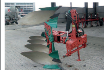
2251459 Kverneland LD 100/200/80R BJ 2003, 4-scharig, 4 Paar Maiseinleger, 4 Paar Anlagesch, Stützrad 200 x 14,5 mit Stoßdämpfer