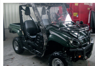
2265815 Yamaha YXR 660 Rhino BJ 2007, Allrad, TÜV bis 2016, - 34 kw, - Allrad, - Differenzialsperre, - 65km/h