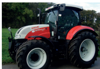
2290113 Steyr Profi CVT 4110 BJ 2013, 360 Bh, 110 PS, stufenloses Getriebe, Druckluftbremsanlage, Fronthubwerk, Gefederte Vorderachse, Kabine