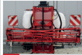
2293295 Reise GS12HY15 BJ 2014, Dreipunktspritze Typ GS 12 HY15, 1200 Liter, 15 mtr hydr klappbar (einseitig klappbar), elektr. Armatur 5 Teilbreiten