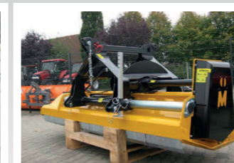
2275148 Müthing MU-M 280 Arbeitsbreite 2,80, Hydraulische Seitenverschiebung, Getriebe mit Freilauf und Durchtrieb für 1.000 U/min, Automatische Keilriemenspannung