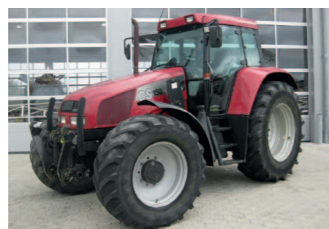
2277743 Case IH CS 150 BJ 1998, 8199 h, Fronthubwerk, Frontlader, Frontzapfwelle, Klimaanlage, Druckluftanlage, 4-fach Zapfwelle, Fronthydraulik