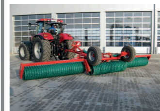
2038469 Kverneland Actiroll 830 BJ 2014 (nicht eingesetzt), Cambridgewalze, Arbeitsbreite 8,30 m, Anhängung über Schwanenhals