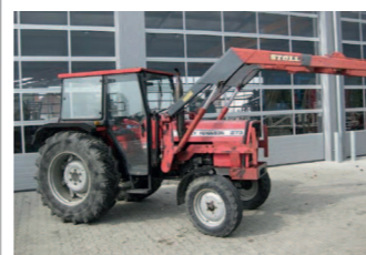
2274076 Massey Ferguson 273 H BJ 1985, 3850 h, Frontlader, Kabine, Niedrigkabine, Doppelt wirkend (1x), 540/1000 U/min, Mauser Niedrigkabine M 30