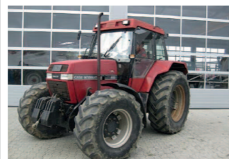
2271492 Case IH Maxxum 5120 BJ 1992, 10469 h, Allrad, Fronthubwerk, 3 Steuergeräte, Druckluftanlage 1/2 Kreis, Fronthydraulik