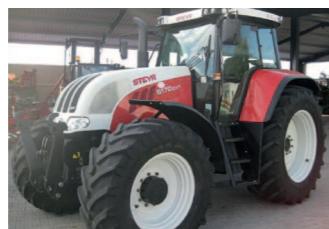
2239933 Steyr CVT 6170 BJ 2005, 5151 h, Fronthubwerk, Klimaanlage, Stufenloses Getriebe, 4 elektr. Steuergeräte, gefederte Vorderachse, gefederte Kabine