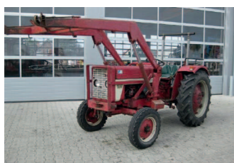
2277746 Case IH 423 BJ 1968, 1836 h, mit Frontlader, Klinklader