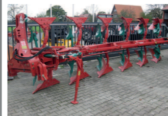
2291565 Kverneland LB 100/300/6xN BJ 2013 (nicht eingesetzt), 6 schar Variopflug, ausgelegt bis 300 PS, Körper Nr. 28, Maisleiger, Transport- und Stützrad