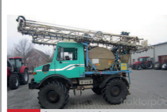
2277742 Inuma 2000 L 24mtr Aufbauspritze 2000 Liter, 24 Mtr, pneumatische Armatur, 6 Teilbreiten, Müller Unicontrol, digitale Druckanzeige