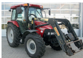
2201471 Case IH JX1090 U BJ 2004, 4599 h, Allrad, EHR, Frontlader, Klimaanlage, 24/24 Getriebe, LS Getriebe, Powershuttle, Klimaanlage, EHR