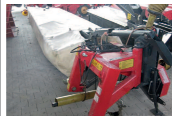
2277745 PZ-Vicon DMP 400 Vicon Scheibenmäherwerk, 4m Arbeitsbreite, seitliche Aufhängung, vertikal klappbar, helle Schutzplane, Druckfeder