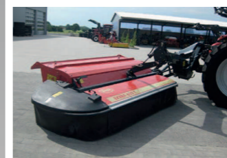
2177335 PZ-Vicon EXTRA 632 T BJ 2010, 3,20 Arbeitsbreite mit Aufbereiter, 3 Klingen pro Mähscheibe, Aufbereiterfinger aus Stahl, Breitverteilhaube mit zentral einstellbaren Leitblechen