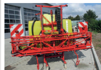
2239934 Rau 14D 15 BJ 1997, Einspülschleuse, 1500 l Fassvolumen, 15 mtr Spritzgestänge, hydr. klappbar (Paketklappung), Einspülschleuse, elektr. Teilbreitenschaltung