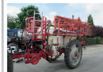
2184129 Holder IN 252 Fassvolumen: 2700 l, Arbeitsbreite: 18/15 m, Bereifung 270/95R48, pneumatische Armatur, 5 Teilbreiten