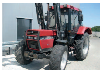
2201472 Case IH 856 XLA BJ 1988, 7950 h, Frontlader, Sensorhydraulik, Zusatzhubzylinder, 2 x DW, Autom. AHK, Druckluftanlage