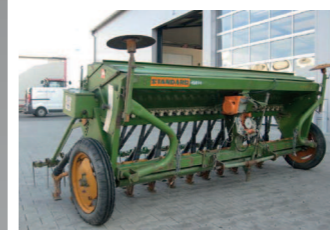
2265820 Amazone D7 3,00 m Fahrgassenschaltung, gebrauchte Drillmaschine, Type D 7 Standard 3,00 m, mit 25 Reihen, Feinsräder Hydro. Spurreißer