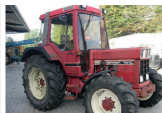
2277744 Case IH 745 XLA BJ 1982, 7875 h, Luftfedersitz, 1 x DW, 1 x EW, (DW), 16/8 Getriebe, Zugpendel, Autom. Zugmaul