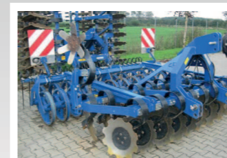
2265814 Köckerling Rebell classic 300 Arbeitsbreite 3m, 510 mm Scheibendurchmesser, Beleuchtung, Nachstriegel, DSTS Walze, Randscheiben