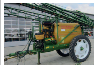
2066829 Amazone UG 3000 Power BJ 2002, Einzelspritze, 3000 ltr Fassvolumen