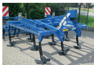
2227908 Köckerling Trio light BJ 2014, - 3m Arbeitsbreite, Rohrstabwalze als Nachläufer, 520 m/m, 10 Zinken