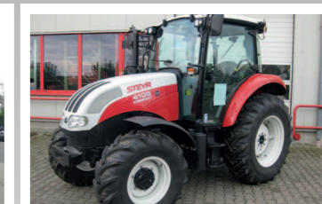
2290112 Steyr Kompakt 4105 Profi Bj 2013, 60 Bh, Leistung: 105 PS, Lastschaltgetriebe, 3 mech. Steuergeräte, 14.9LR20 FIX 16.9R30