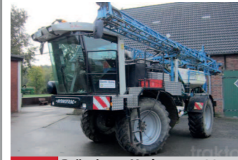
2292346 Bräutigam Hydrotrac 100-4 BJ 2006, Selbstfahrer, Fassvolumen 3000 Ltr., 24 m Arbeitsbreite, Vollausstattung