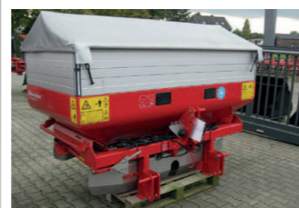
2291567 Kverneland CL 2000E BJ 2013, 2000 l Behälterinhalt, Grenzstreueinrichtung, Beleuchtung, Trichterabdeckung, elektrische Bedienung