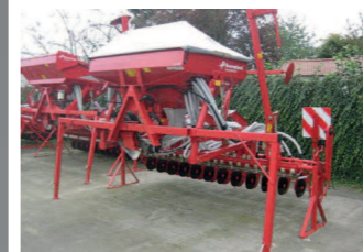
2265119 Kverneland DA 24CX BJ 2014 (Vorführmaschine), Arbeitsbreite 3 m, 24CX Schare, Keilriemenüberwachung, 2 zusätzliche Kombiklappen