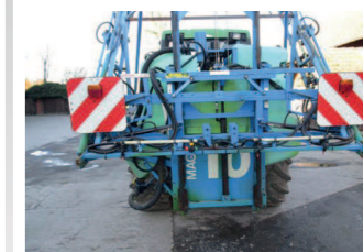
2038472 Berthoud MACK 10 BJ 1997, Bordcomputer, Einspülschleuse, Teilbreiten (5x), Hydraulische Klappung, Fassvolumen: 1000 l