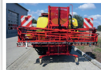
2291564 Reise GS 10 HY15 Einspülschleuse, Baujahr, Fassvolumen: 1000 l, Arbeitsbreite: 15 mtr hydr. klappbar, Halbcomputer, Einspülschleuse