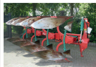
2229575 Kverneland 150B/4schar BJ 2014 (Vorführpflug), 4 schar Pflug, Körper Nr. 28, Stützrad 200 x 14.5, 4 Paar Maisleiger