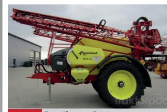
2291569 Rau Ikarus S 38 BJ 2014, Anhängerspritze, Fassvolumen 24 mtr Gestänge, Vollcomputer, Bereifung 460/85R38 (= 18,4R38), Vollausstattung