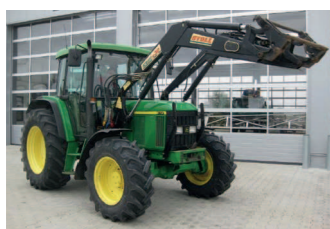
2273435 John Deere 6110 A BJ 2002, 6230 h, Frontlader, Druckluftanlage 1 + 2 Leiter, 2 x DW, 540/1000 Zapfwelle