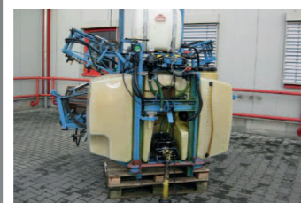
2290111 Tecnomas 1000 Liter 15mtr Fassvolumen: 1000 l, Arbeitsbreite: 15 mtr, elektr. Armatur, 4 Teilbreiten, Spritzen TÜV, Beleuchtung