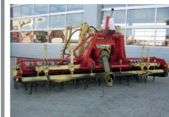
2265819 Krone KES 85 / 3000 Arbeitsbreite 3,0 m, mit Zahnpackerwalze, Hydro. Hubgestützte, Spurlockerer, 12 Zinken