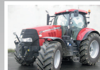
2292347 Case IH Puma CVX 230 Profi BJ 2012, 645 h, Druckluftbremsanlage, Fronthubwerk, Gefederte Vorderachse