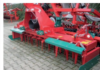
2291566 Kverneland NGM-301 BJ 2014, 3m Arbeitsbreite, 12 Zinkenträger, mit Seitenblechen, Crackerwalze