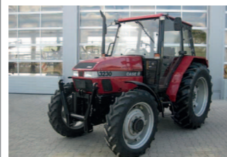
2263384 Case IH 3230 BJ 1996, 3872 h, Fronthubwerk