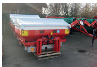
2157679 Kverneland CL EW BJ 2013, Behältervolumen: 1450 l, Focus Terminal, Mit ITH-Kabel, Grenzstreueinrichtung, Beleuchtung