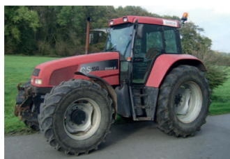
2291571 Case IH CS 150 BJ 1996, 9900 h, Druckluftbremsanlage, EHR, Fronthubwerk, Lastschaltgetriebe, EHR, Klimaanlage, 4-fach Zapfwelle