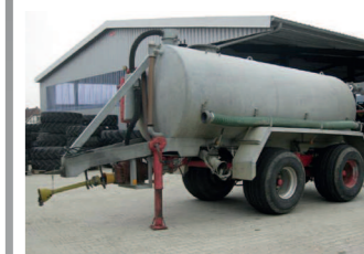
2036050 Wienhoff VTW 12.000 BJ 1997, Wienhoff Vakuumtankwagen, 12.000 ltr Inhalt, starre Achsen, DL, Parabelfederung, Eisele Schiermverteiler