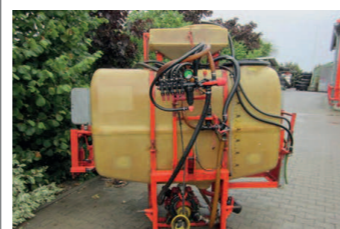
2157656 Jacoby 800 Liter 12mtr Fassvolumen: 800 l, Arbeitsbreite: 12 mtr handklappbar, mech. Armatur, 5 Teilbreiten, Beleuchtung mit Warntafel