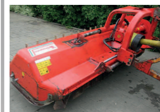
2291563 Drago V 220 SHTG BJ 2009, Arbeitsbreite: 2,20 m, tiefer liegendem Getriebe, Hydr. Seitenverstellung, Holzaufnahmezinken