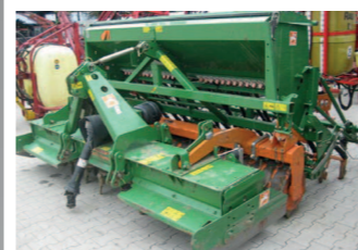
2246021 Amazone KE303/AD303 BJ 2007, Nachlaufwalze, Kreislegege KE 303 Spezial, m. Planierschiene, Zahnpackerwalze 450 m/m, Aufbau Drille AD 303 Super