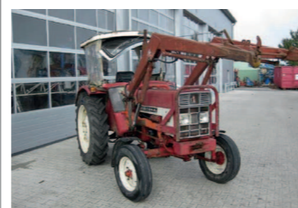
2277747 Case IH 423 BJ 1973, 11729 h, Hinterrad - IHC 423, 32 km/h, Klinklader, Gr. 2, Gabel, Schaufel, Bereifung: 6.50-16 und 12.4-32