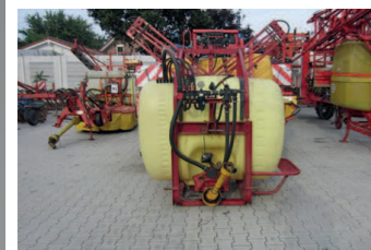
2239936 Hardi NK 800 Fassvolumen: 800 l, Arbeitsbreite: 12 mtr, 3 Teilbreiten, Spritzen TÜV neu