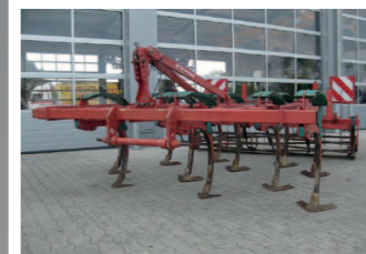
2271494 Kverneland CLV Grubber 3m, 4 balkig, Gänsefüße mit Spitzen, Nivellierer, Rohrstabwalze und Striegel