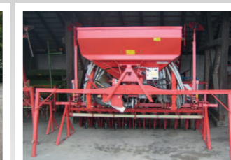
2157663 Kverneland S-Drill 3,0 24-cx 14.286 €, Fahrgassenschaltung mit Spuranreiser, Arbeitsbreite: 3m, 24 CX Schare, Tankinhalt: 1050 l