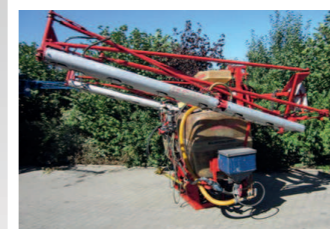
1815283 Jacob Eurosuper 1500 ltr BJ 1993, Einspülschleuse, Teilbreiten (4x), Hangausgleich, Hydraulische Klappung, Schleppschläuche