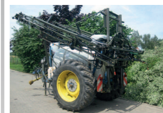
1678416 Tecnomat 2000 Liter 21Mtr Fassvolumen 2000 Liter, Arbeitsbreite 21mtr, 7 Teilbreiten