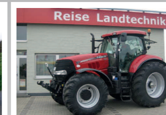
2290114 Case IH Puma CVX 185 Profi BJ 2014, 400 Bh, Leistung: 185 PS, stufenloses Getriebe, Druckluftbremsanlage, Fronthubwerk, Gefederte Vorderachse, Kabine