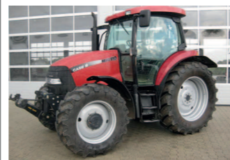
2290116 Case IH MXU 110 BJ 2004, 7479 h, Druckluft, 16/16 Getriebe 40 km, 420/70R28 u 520/70R38