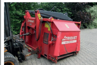
1672942 Trioliet Masterkamm BJ 2004, Ausgerüstet mit Reißkamm und Restgutklappe, Schnellkuppelachse, Zwei stabile Ladearme