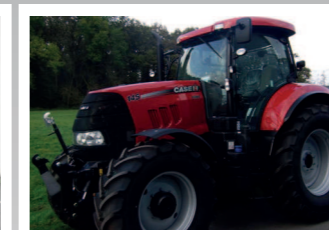
2290115 Case IH Puma 145 Profi Bj 2014, 200 Bh, Leistung: 145 PS, Lastschaltgetriebe, Druckluftbremsanlage, Fronthubwerk, Gefederte Vorderachse, Kabine