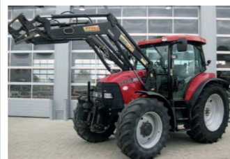
2291562 Case IH MXU 110 Komfort 1 BJ 2006, 5370 Bh, Fronthubwerk, Frontlader, Klimaanlage, Druckluftanlage, Fronthydraulik, 4 Zusatzsteuergeräte